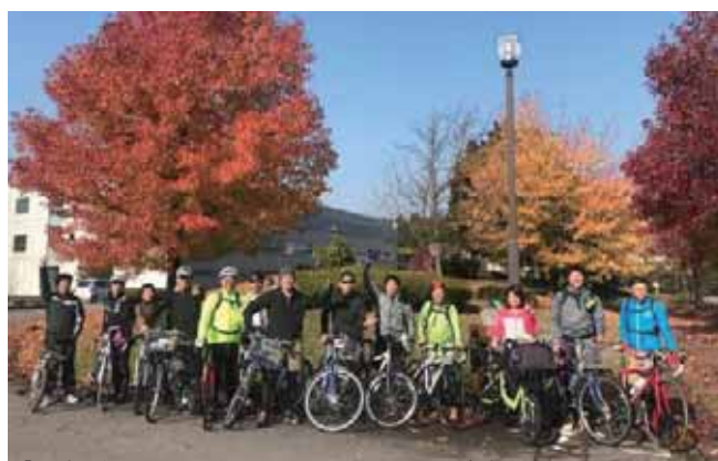
「地域を知る活動」白山キャニオンロードを疾走

私たち中小企業は地域と未来を共にする不離一体の関係なのです。その事を自覚して、よい会社・よい経営者・よい経営環境を学び、実践し、拡げていくことが使命なのではないでしょうか。