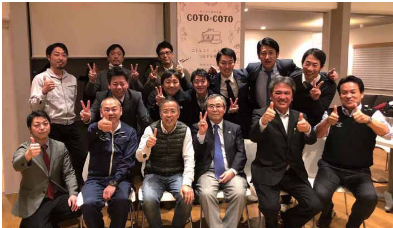
新しい取り組みに向けて一致団結

地域の課題を解決し、地域の資源を生かし、新たな価値を生み出すことで仕事も雇用も増やしていく。その結果、地域で生まれた若い力を地域で生かしていく風土が生まれます。地域づくり・仕事づくり・人づくりは、私たち地域に根付く中小企業の重要な役割なのです。